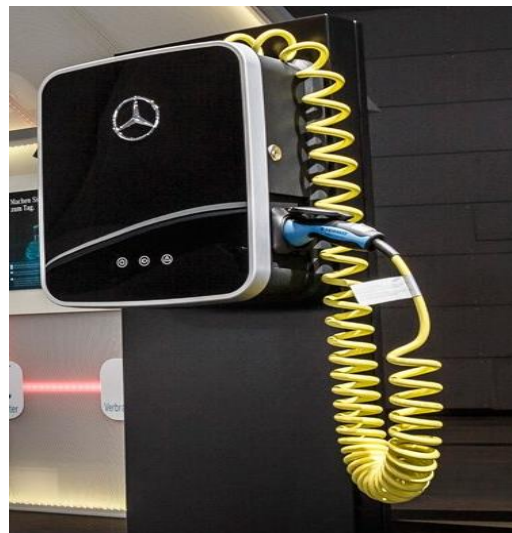
WallBox Mercedes-Benz *Opcional con costo