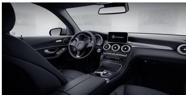
Molduras de madera fresno negro de poros abiertos