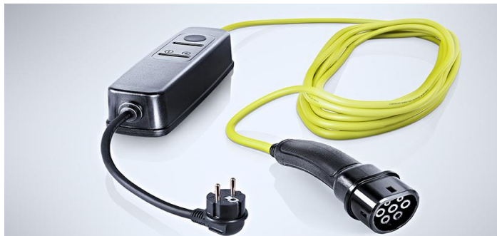
Enchufe red doméstica 220V *Incluido