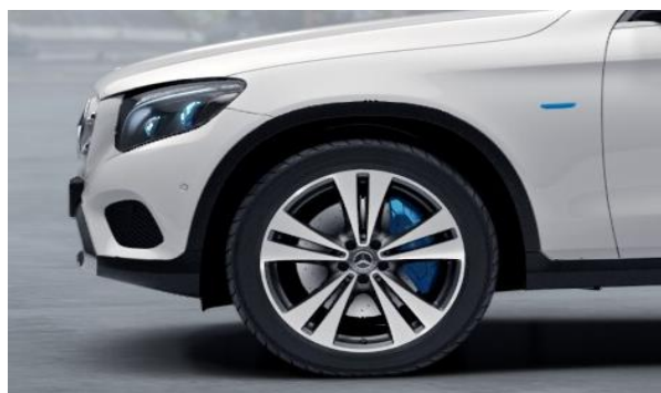
Llantas 50,8 cm (20") y 5 radios dobles